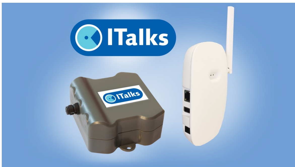
Kit de démarrage indoor MCS ITalks Lora Full avec la station LoRaWAN™ Kerlink Wirnet™ iFemtoCell

Kerlink annonce que MCS, intégrateur de systèmes hollandais, renforcera son partenariat actuel avec un accord de distribution à valeur ajoutée, pour la promotion de ses solutions IoT